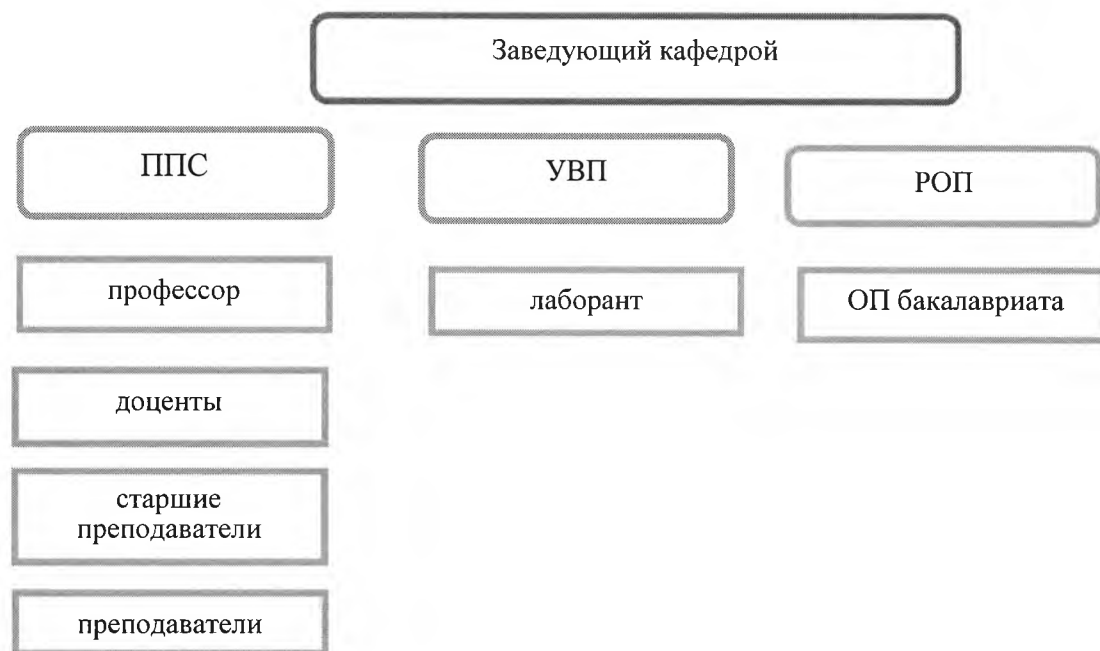
Рисунок 1 – Структура управления кафедры менеджмента

4.7 Структура кафедры представлена на рисунке 1.